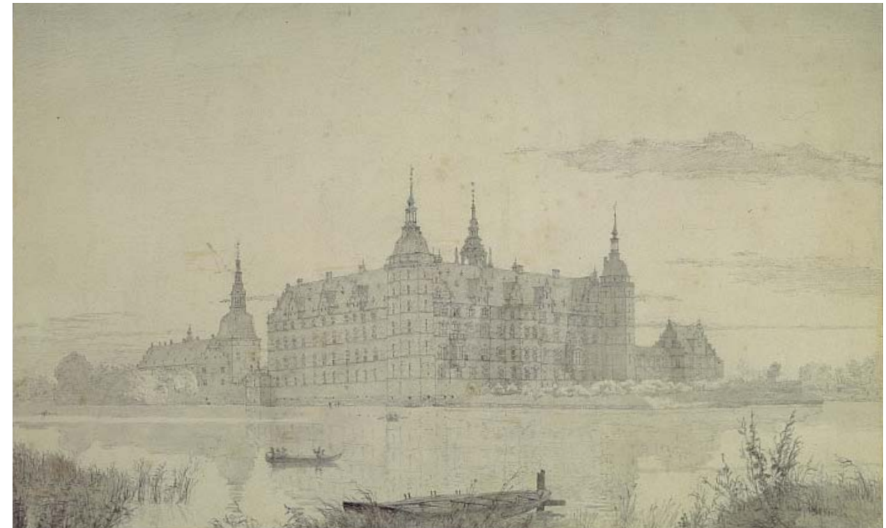
3 Frederiksborg set fra nordvest. Tegning af Christen Købke 1835. Frederiksborgmuseet.

Kunsthistorikeren Hanno-Walter Kruft definerer arkitekturteori som »the history of thought on architecture as recorded in written form«. 1 Kun i dialog med hinanden kan arkitekturens teori og selve arkitekturen blomstre, hævder Kruft, idet han præciserer: »The former can be a statement, a codification of practice, or a programme; and the quality of the corresponding architecture serves as a gauge of the usefulness of the theory. It must be possible to check architectural theory by reference to actual buildings. And may one also conclude that good architecture is – or even has to be – always capable of justification in terms of some theory?« 2 Derfor har jeg stillet mig denne opgave: for det første at kortlægge historicismens arkitekturteori, for det andet at kontrollere teoriens brugbarhed ved undersøgelse af et konkret bygningsværk: Frederiksborg Slot.